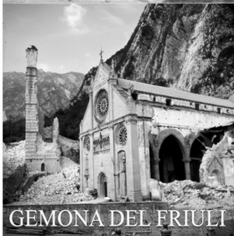
GEMONA DEL FRIULI