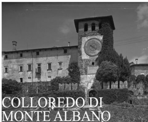
COLLOREDO DI MONTE ALBANO