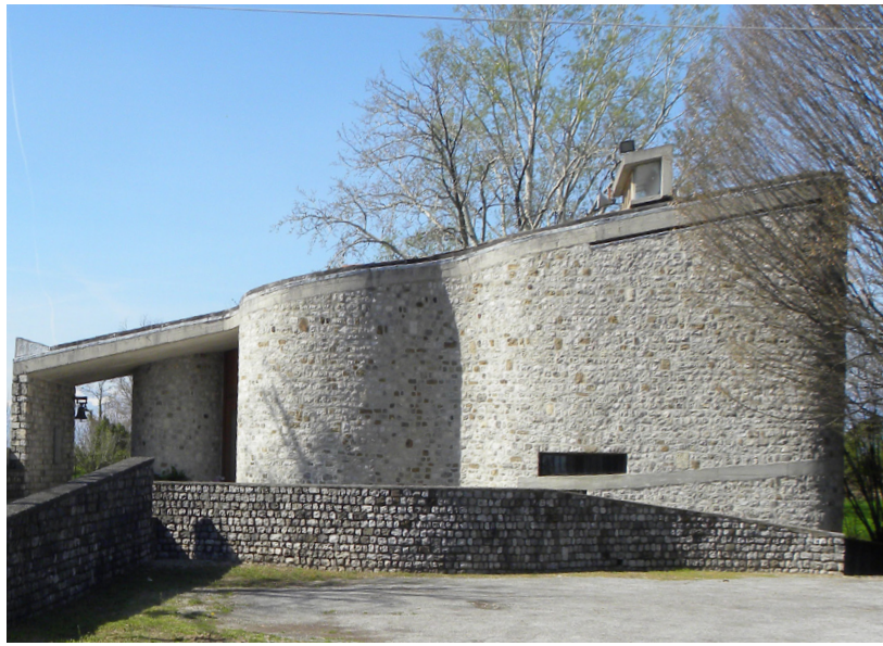
G. Gresleri – S. Varnier, Oratorio di Nostra Signora di Lourdes, Navarons di Spilimbergo (PN).